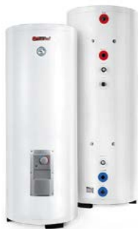
Комбинированные (кос- венные) водонагреватели