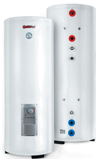
Комбинированные (кос- венные) водонагреватели