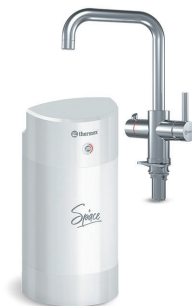
Мультипот система кипячения питьевой воды